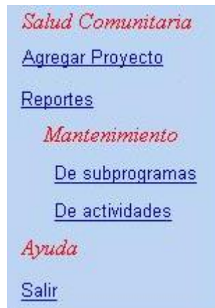
Imagen 1. Pantalla inicial del usuario Médico

En la imagen 1 se presenta el menu de este usuario, con las opciones que utilizara.