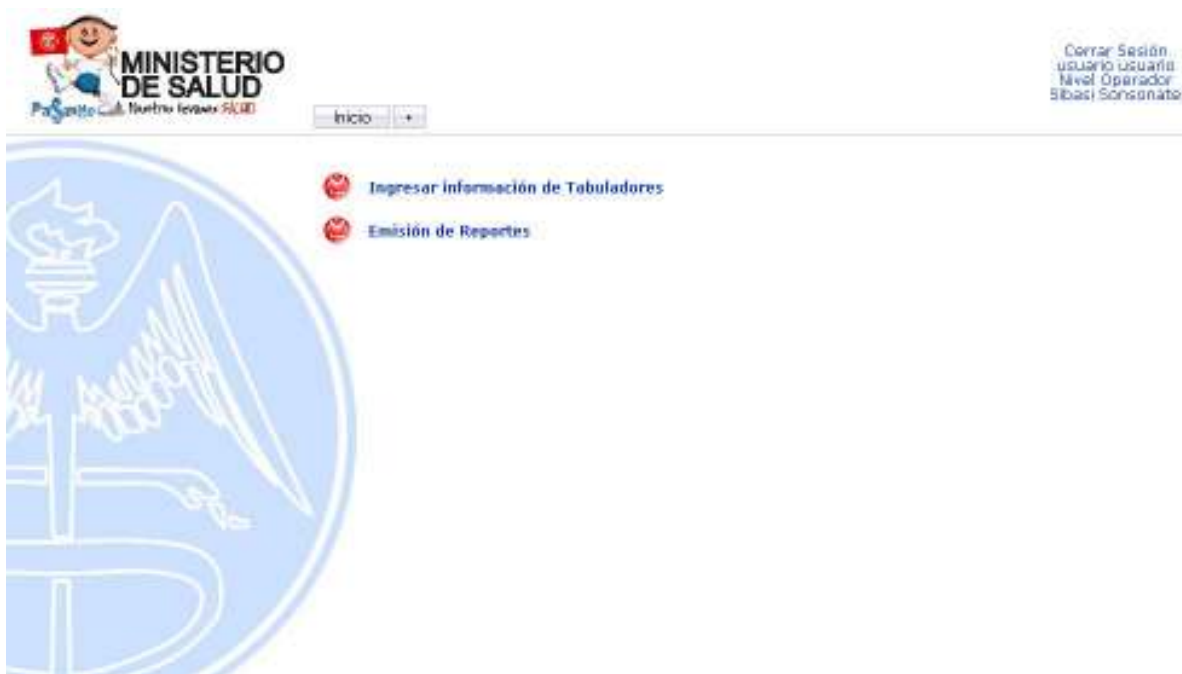
Figura No. 3