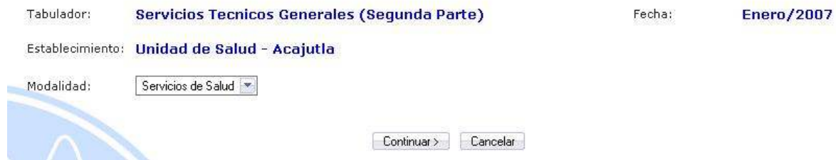
Figura No. 7

La información que se debe seleccionar es la siguiente: