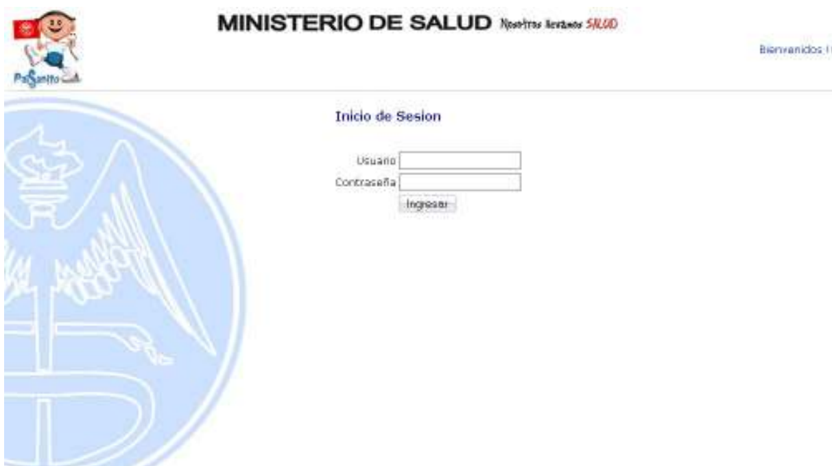
Figura No. 2

Al iniciar en la aplicación aparecerá la pantalla de inicio de sesión, en la cual deberá ingresar su usuario y contraseña, luego dar clic en ingresar, tal como se muestra en la figura No. 2.