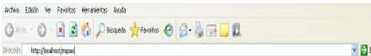
Figura No. 1

Para poder ingresar a la aplicación primero debe abrir el Internet Explorer, luego digitar en dirección: http://localhost/mspas tal como se muestra en la figura No.1.