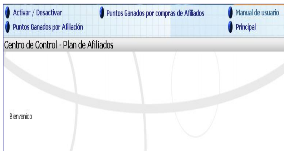
FIG. 9.1 Pantalla Principal