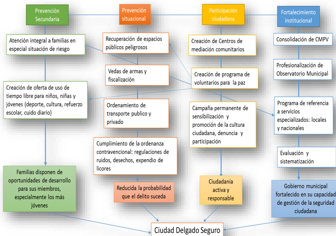
Grafica1: Plan Municipal de Seguridad Ciudadana y Convivencia de Ciudad Delgado