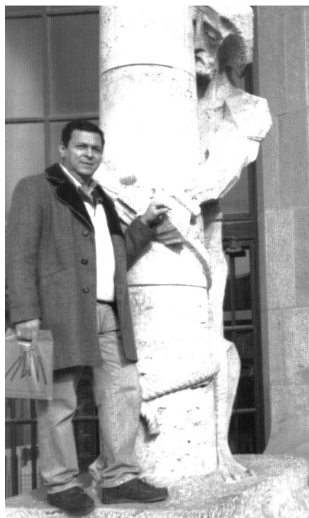
En Barcelona, Basílica de la Sagrada Familia. (España)

Por la tarde me llamó para entregarme el pasaje Turín-Brazaville-Conakry. Me entregó otro pasaje de tren para Turín y unirme así a otros misioneros de la expedición del Centenario: una semana de salesianidad y la entrega del Crucifijo el veinticuatro de agosto en la Basílica de María Auxiliadora. Fue un acto maravilloso presidido por el Rector Mayor, P. Egidio Viganó. Éramos treinta y ocho los enviados a distintas partes del mundo.