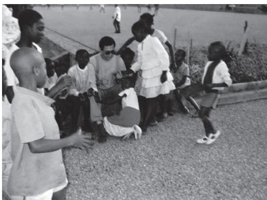
Grupo de kisisito

Tuve la oportunidad de visitar varias familias de niños que me invitaron a su fiesta. Era la primera vez que entraba a alguna casa en Camerún. Se veían sencillas, limpias, amuebladas, y otras, hasta con cierto lujo como alfombras, lámparas, cielo falso, etc. Todas ellas tenían una plantación de maíz, tomate, chile, yuca en lugar de flores, y con uno que otro árbol de mango o guayabo.