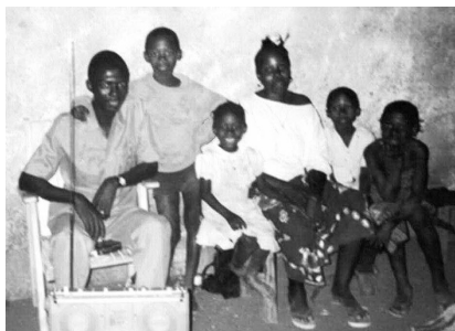
Mi familia (Batania) en África.

Los salesianos estuvimos juntos compartiendo un poco y después nos fuimos a la ciudad para participar en la misa principal de la misión. Al terminar, pasé a saludar a mi familia. Había una gran alegría, un motor generaba luz, había música y baile. Nunca había bailado y aquí tuve que hacerlo, no sé ni cómo, lo importante era estar con ellos. Estaba toda la familia: padres, suegros, hermanos, sobrinos. Habían venido del pueblo natal, cargados de frutas, legumbres, pescado seco y ahumado, carne bucanera – mono, antilope, elefante, gallinas, pentade, huevos, gusanos, todo ahumado para que aguantara el viaje y, aunque alguno no aguantó, no importaba, porque el fuego todo lo purifica. El calor de la cerveza, el vino, el kein kein, el vino de palma, comenzaba a subir por la cabeza y todos estaban más contentos y alegres que lo normal.