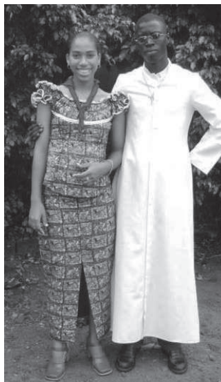
Nuevas vocaciones Sacerdotales y religiosas

Unos días más en Dabadogou, para dejar todo en orden. Claro, me sentía extraño, con deseos de ver a mis familiares y amigos y, al mismo tiempo, sin deseos de marchar por permanecer con esta gente a quien tanto amo. Era una mezcla de sentimientos encontrados, una lucha interior. No me quedaba otra alternativa que salir el trece de diciembre hacia