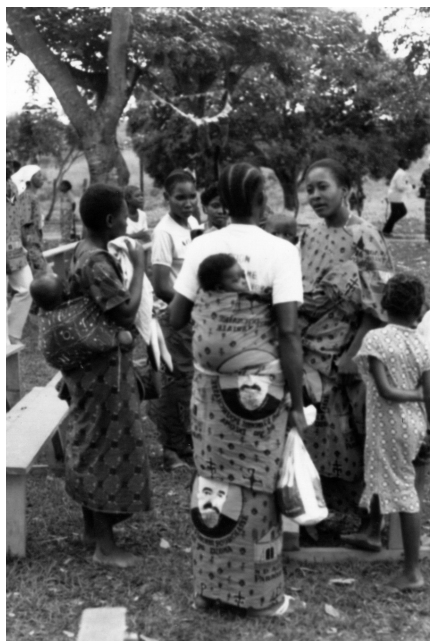
Asociación de "Madres marianas" para hogares cristianos

Junio es un mes tranquilo. Esta vez le corresponde a otro la conclusión del curso escolar. Mis calificaciones y exámenes