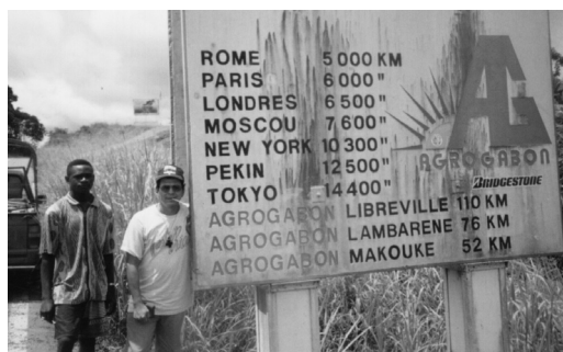
Pasando el Ecuador en la República de Gabón

Ellos ganaban hasta el triple de su salario normal y yo ganaba aún más, pues tenía la oportunidad de conocer el verdadero rostro y forma de ser de los habitantes de los pueblos. Su vida diurna y nocturna, sus creencias, fetiches, forma de cazar. Y, sobre todo, me daba la oportunidad de promover por la noche un poco la vida cristiana. Había sido un gran negocio, aunque hubo que invertir algo.