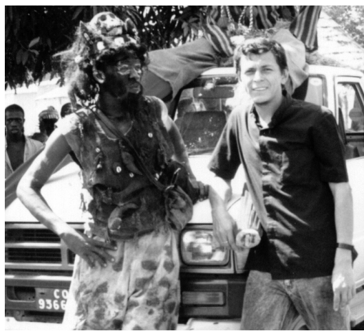
Con miembros de baleles tradicionales.

Me permitieron hacer una oración. Depositaron el cadáver en la tumba mientras las mujeres preparaban las grandes ollas de carne de cabra en salsa de maní, arroz en abundancia y yuca molida. Debajo de una gran enramada fueron colocados muchos petates para sentarse y, como invitado de honor, estuve junto al papá del joven difunto. Luego seguirían los parientes.