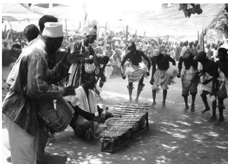
Música y danza en el alma africana

Con todo eso, la entrega de trabajos se realizaba en más tiempo del previsto, y esto me traía altercados con algunos clientes. Las monjas, por cierto, eran las menos comprensivas. En mi vida jamás había visto monjas tan intransigentes, neocolonizadoras y negreras como algunas ‘misioneras’ en Guinea.