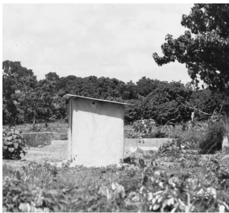
Proyecto “Servicios Higiénicos”.

En los primeros días de diciembre reunimos nuevamente a los encargados de grupos para ver las actividades y ponernos de acuerdo en ciertas decisiones a tomar. Se propuso una misa a media noche el veinticuatro y el treinta y uno, se confirmaron las casas a visitar con la pastorela y se comprometieron a escribir algo sobre las actividades para el nuevo número de la hoja parroquial. Feliz Navidad y feliz Año Nuevo.