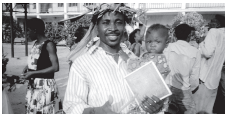
Alegria de nuevos adultos bautizados.

Las actividades se sucedían: clases de religión, tutoría de los primeros cursos, retiro de profesores y alumnos, encargado de grupos juveniles los fines de semana, toma de conciencia de la solidaridad social con sectores menos favorecidos, seguimiento de cooperadores salesianos, etc.