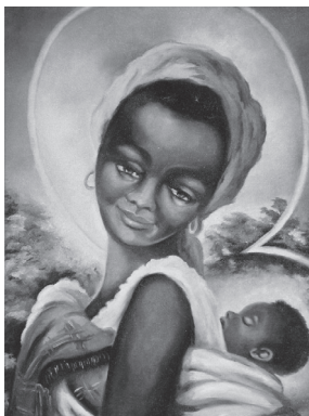
Nuestra señora de África

Lo mismo sucederá para la sala de juegos. La medida es dura, pero la comunidad de salesianos aprovechó mi ‘novatada’, como se decía allí, para poder controlar lo que es nuestro, pues, las exigencias de parte de ciertos jóvenes eran cada vez más imperativas. Lamentablemente la mentalidad de los jóvenes en su mayoría era: ‘Si son blancos, tienen dinero y tienen que darnos’.