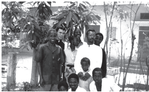
Única familia cristiana en Dabadougou.

En noviembre realicé el primer encuentro de responsables de grupos, para explicarles qué es una parroquia y un consejo parroquial, proponer algunas ideas para la Navidad y Año Nuevo. Así pues, el dieciséis de noviembre, nos reunimos los representantes de dieciséis grupos: ADMA, Cáritas, coro A, coro B, confirmación, enfermos, comunión, teatro, deporte, artesanos, y los que había comenzado hacía apenas unos meses, Kisito (niño santo africano), acólitos, lectores, bíblico, post confirmación, catequistas, aspirantes.