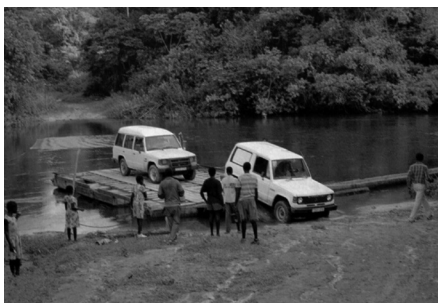
Pasando el majestuoso río Níger