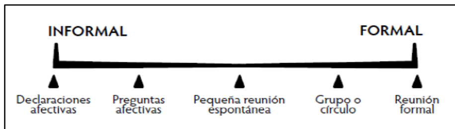
Figura 1. Espectro de prácticas restaurativas