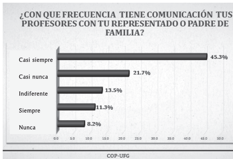
Gráfico 2. Frecuencia en la comunicación del docente con los padres de familia.