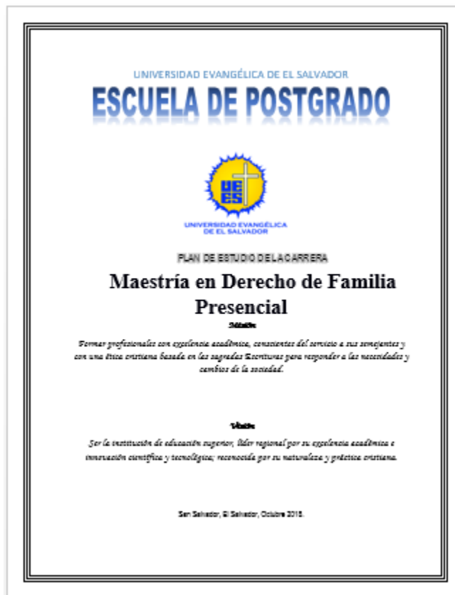
Figura 1. Plan de Estudio de Carrera de Maestría en Derecho de Familia

La propuesta de solución ante las problemáticas planteadas en los capítulos anteriores obedece a la necesidad imperante de realizar cambios sustanciales en el diseño curricular a nivel de Postgrado de la Universidad Evangélica de El Salvador. A continuación se presentan la imagen de ambos productos: